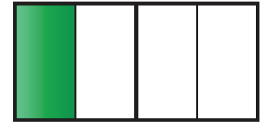
Dom A Dom B Dom C Dom D