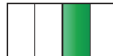
Dom A Dom B Dom C Dom D